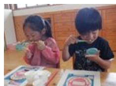
歯みがきの仕方も楽しく学びます。