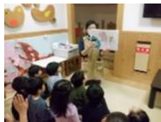
「便秘・手洗い」のお話をしました。