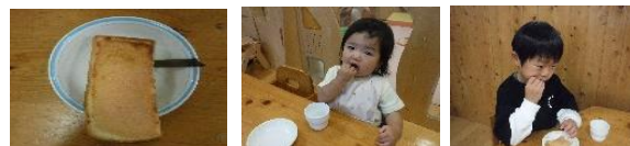
たらこトースト と昆布