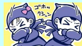
イラスト：青鹿ユウ

咳をする時、口元を手のひらで覆っていませんか？実はこれは、多くの人がしている誤った咳エチケット。咳の飛沫で出た菌やウイルスを手で受け止めると、そこから感染を広げてしまいます。園では、咳をする時は、右図のように、「忍者に変身！」スタイルなど、咳を腕で防ぐことを子ども達に勧めています。