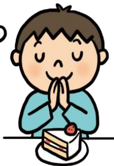
おやつは、じかんをきめて食べる

ダラダラ食べると、いつまでも口の中に食べ物があるので「歯」にもずっとずっと食べがついたままになり、虫歯になりやすくなるよ。ダラダラ食べず時間を決めて食べようね。