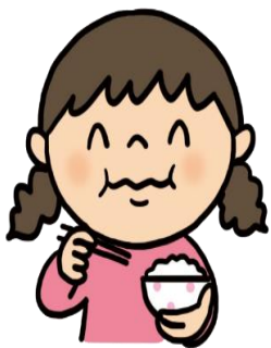
よくかんで食べる

よく噛むと、唾液がたくさんでるよ。歯についた食べかすを落としてくれたり、虫歯になりにくくしてくれたりする働きがあるよ。よく噛んで唾液パワーをだそうね。